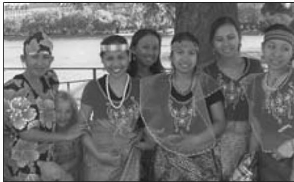
Philippinske aupair-piger i Danmark optræder