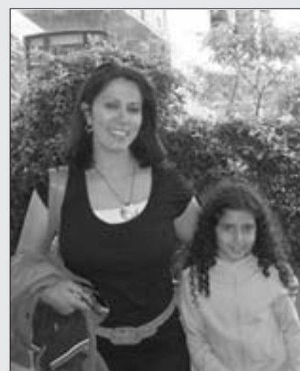
En irakisk kvinde der snart skal op til statsborgerskabsprøve, fotograferet ved Københavns Internationale dag 9.09.2007

Vi har gemt en facitliste på en an- den side her i bladet. Vil du prøve hele den omvendte integrations- prøve, så gå ind på vores hjemme- side: www.sosmodracisme.dk under Integrationsprøven. De rigtige svar på denne står under Nyheder