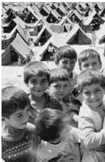
Irakiske flygtningebørn i Tyrkiet.