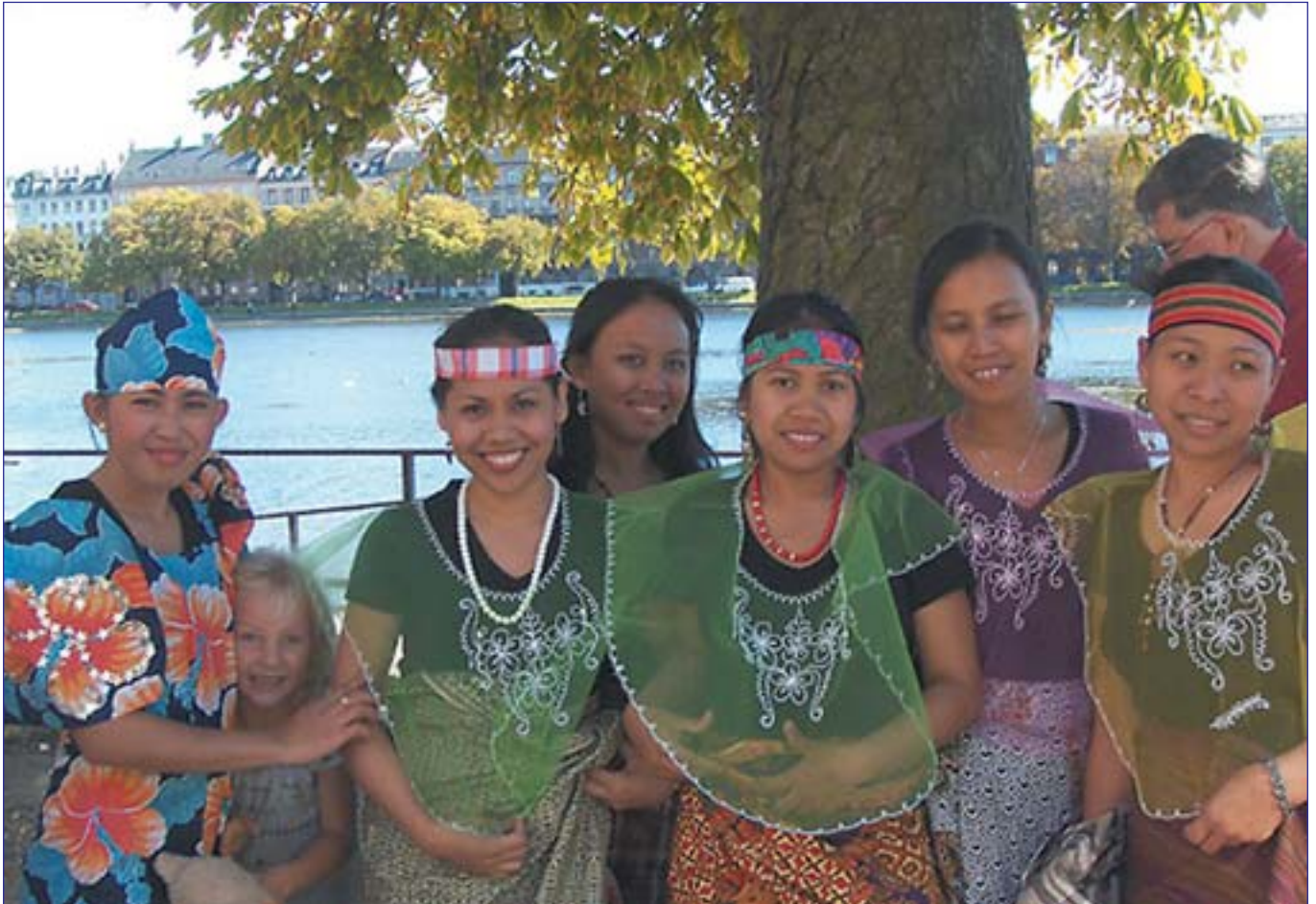
Fra Københavns Internationale Dag, 9. september 2007