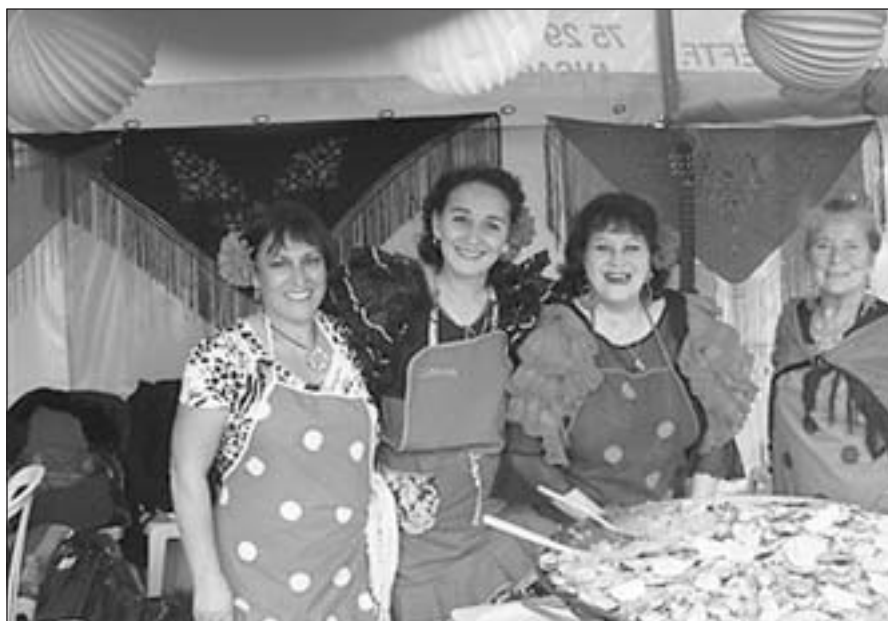
Medlemmer af dansk-spansk forening, Københavns Internationale Dag.

For at få asyl, dvs. få opholdstilladelse efter udlændingelovens § 7, skal en asylansøger opfylde de betingelser, der er nævnt i FN's flygtningekonvention, eller de betingelser, der er nævnt i udlændingeloven om beskyttelsesstatus. Beskyttelsesstatus gives, hvis en asylansøger har krav på beskyttelse