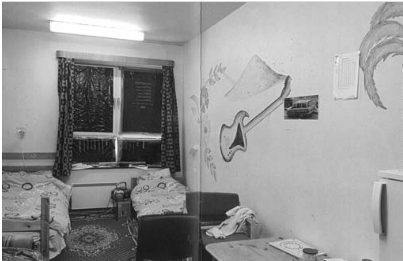
Fra Henrik Saxgrens bog "Krig og kærlighed"

har siddet der - officielt - i op til 7 år, men der høres ofte om opholdstider på mere end 9 år, og det gælder også familier med børn. Mange familier er splittede i hver sit land, fordi de er flygtet hver for sig, og er afskåret fra at søge familiesammenføring, så længe de ikke har opholdstilladelse. En del af asylansøgerne er blevet psykisk syge; nogle direkte psykotiske, andre har fået forværring i deres PTSD, nogle er blevet apatiske. Nedgangen i antallet af asylansøgere har medført at mange asylcentre er blevet nedlagt. Det har indebåret mange flytninger af asylansøgere.