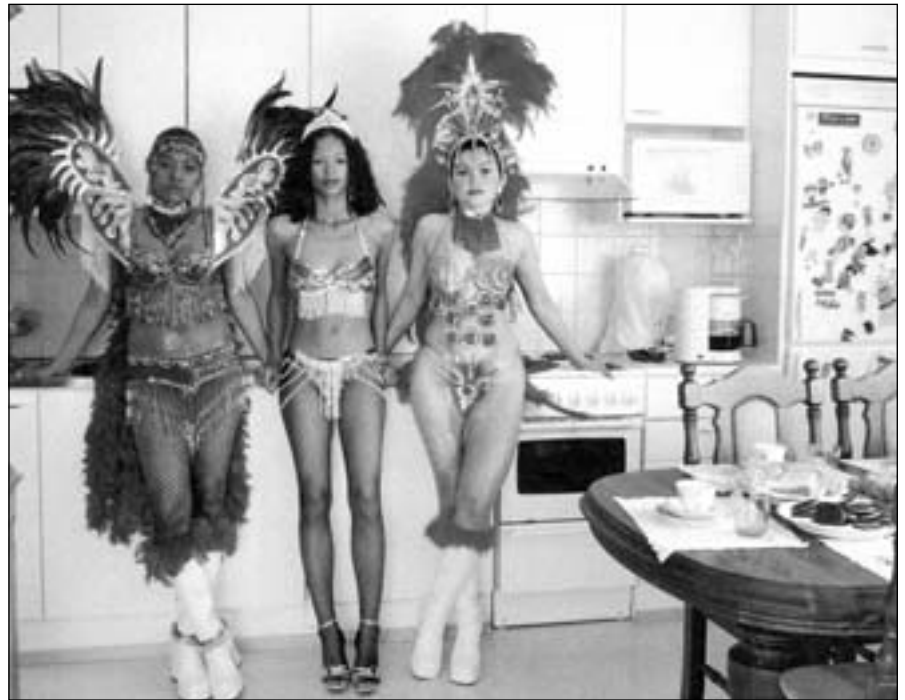
3 brasilianske kvinder bosiddende i Oulu, Finland hvor de har dannet en sambagruppe.

Da en afrikansk studiekammerat ringede fra Danmark og tilbød ham et job på Esbjerg Sygehus, slog han straks til. Muhammed kom på røntgenafdelingen og lærte hurtigt at sige de mest nødvendige ord på dansk. Hold vejret og træk vejret. Det var nok. Han mødte en dansk sygeplejerske og giftede sig med hende i 1972. Han adopterede hendes 3 børn, og sammen fik de 2 mere. Han lærte sit grundlæggende dansk ved at læse Anders And med børnene.