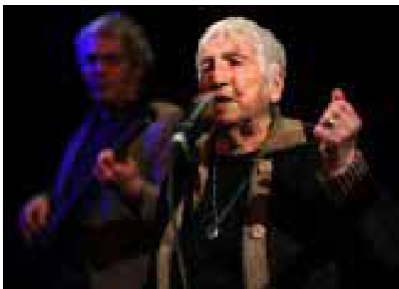
Den 85-årige Esther Bejarano på scenen ved en koncert med Microphone Mafia og Coincidence.

Esther Bejarano, der under krigen var medlem af et pigeorkester i koncentrationslejren Auschwitz, har lige siden krigen fortalt omverdenen om nazismen og holocausts rædsler gennem musik. I takt med at tiden og musikken har forandret sig, har Bejarano de seneste par år dog måttet ty til noget utraditionelle metoder.