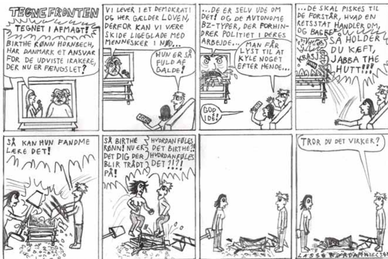
Bragt i Blomster og barrikader nr 5, 2009.