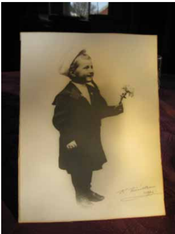
Min Far siger et digt fra Farmor til Farfar

Far var ganske vist selv jøde, født af tyskødiske forældre, der var kommet til Danmark ved århundredets begyndelse, fordi min farfar havde en ekspertise med hensyn til de maskiner som typografer brugte. Det arbejde underviste han danske typografer i.