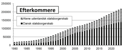
Figur 2: Kilde: Statistikbanken, Danmarks Statistik, FOLK2. Alle aldersgrupper. Den sorte del af søjlerne viser antal efterkommere med dansk eller dobbelt statsborgerskab. Den skraverede del: efterkommere uden dansk statsborgerskab. I 2024 har 63% dansk statsborgerskab, mod 82% af efterkommere over 18 år.